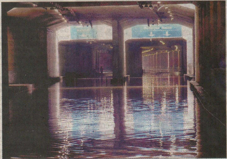
The waterlogged Okhla underpass in New Delhi on Sunday.

predicted overcast conditions and heavy rain on Monday and Tuesday, adding that heavy rains at isolated places in Delhi and adjoining states are likely until July 4. The department also forecast moderate rain and thunderstorms accompanied by gusty winds on Sunday night.