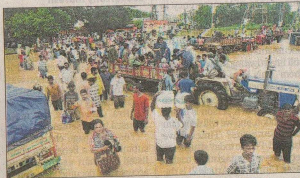
People wade through a waterlogged road in Vijayawada.

"The MHA today constituted a central team of experts, led by the Additional Secretary (Disas-