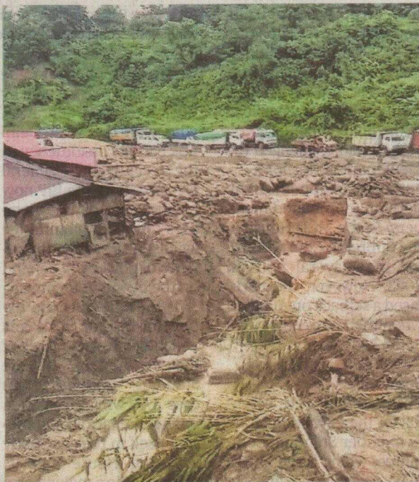
Washed away: A portion of NH-29 damaged in a landslide in Chumoukedima district of Nagaland on Wednesday.

"The details of two others are being ascertained. Search and recovery oper-