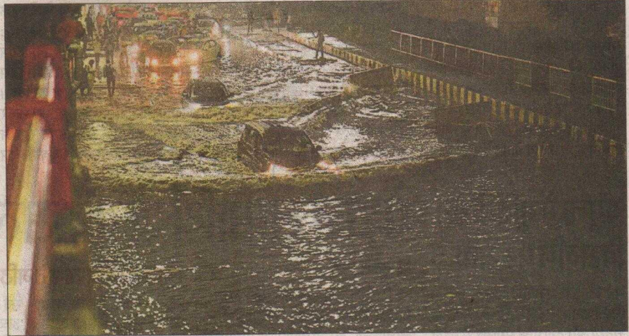
दिल्ली में गुरुवार शाम हुई बारिश के बाद पटपड़गंज इलाके में जलभराव के बीच गुजरते वाहन। • सोनू मेहता

सुबह 8.30 बजे सुबह तक राजधानी के कुछ इलाकों में हल्की बारिश दर्ज की गई। इसके बाद शाम 5.30 बजे तक राजधानी के कई इलाकों में बूढ़ाबांड़ी हुई। मौसम विभाग के अनुसार, शुक्रवार को राजधानी में गरज चमक के साथ बारिश होने की संभावना है। इस बीच अधिकतम तापमान 33 और न्यूनतम 24 डिग्री सेल्सियस रहने के आसार हैं। बुधवार को अधिकतम तापमान 33.6 डिग्री रहा।