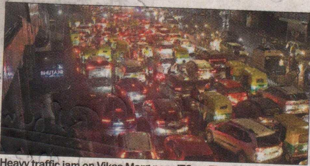
Heavy traffic jam on Vikas Marg near ITO on Thursday.

major traffic congestion, with roads such as Vikas Marg experiencing long traffic jams. Commuters faced considerable delays reaching their destinations due to stag-