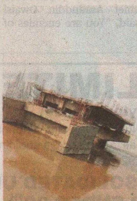
A bridge across the Ganga collapsed in Katihar on Thursday.

Residents said it had rained continuously for the