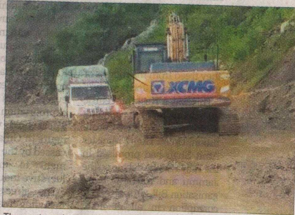
The restoration work in progress on the Chandigarh-Manali highway at 9 Miles in Mandi on Thursday.

The highway's temporary closure led to significant delay for both commuters and commercial transporters. However, light vehicles were diverted to alternative routes between Mandi and Kullu to miti-