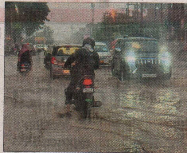
Vehicles pass through a waterlogged road in Faridabad city on Friday.

waterlogging due to the weak and obsolete drainage infrastructure.