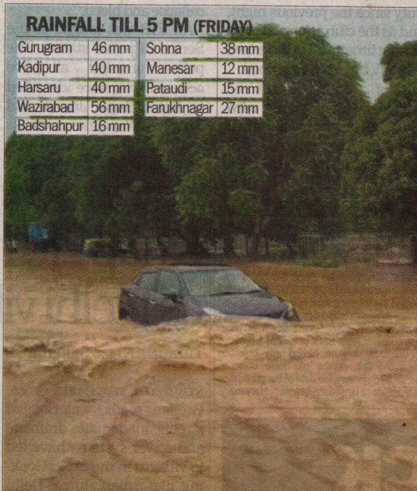
A car crosses a waterlogged road near IFFCO Metro railway station in Sector 29, Gurugram city.