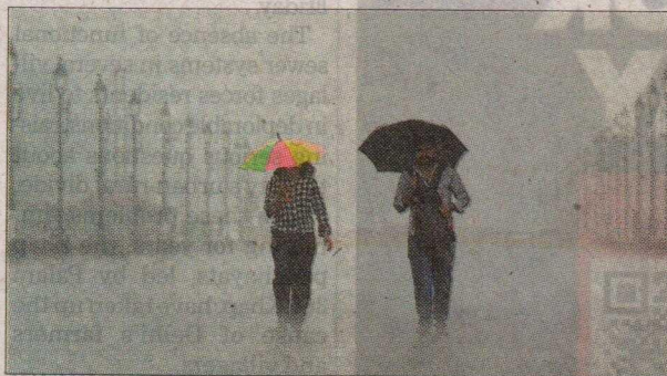
Visitors during rain at Kartavya Path in New Delhi on Friday.