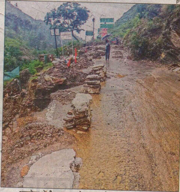
अल्मोड़ा में नेशनल हाइवे 109 कई जगह से टूट गया है।

बीते दो दिनों से केदार घाटी में हो रही बारिश के कारण केदारनाथ पैदल मार्ग कई जगहों पर बाधित हो गया। इसके चलते केदार यात्रियों को सोनप्रयाग में रोका गया है। बदरीनाथ हाइवे भी ऋषिकेश-बदरी राष्ट्रीय राजमार्ग नंदप्रयाग और कमेड़ा में लगातार भूस्खलन होने के चलते बार-बार बंद हो रहा है। हाइवे बंद होने से बदरीनाथ सहित हेमकुंड यात्रा पर जा रहे श्रद्धालुओं सहित स्थानीय लोग भी परेशान हो रहे हैं। बारिश से सड़के जगह-जगह बंद हैं तो नदी नाले उफान पर हैं। उत्तराखंड के पहाड़ी इलाकों में हो रही मूसलाधार बारिश के चलते गंगा और उसकी सहायक नदियां उफान पर हैं। ऋषिकेश के गंगा घाट और तट जलमग्न हैं। गंगा का जलस्तर चैतावनी रेखा के पार पहुंच गया है। त्रिवेणी घाट पूरी तरह जलमग्न हो गया है। प्रशासन की टीम गंगा के तटीय इलाकों में रहने वाले लोगों को अलर्ट कर रही है। लोगों को सुरक्षित स्थानों पर रहने के लिए मुनादी की जा रही है। हल्द्वानी के नदी-नाले उफान पर हैं। भारी बारिश के चलते मंडी चौकी के पास शनि बाजार स्थित नाले में ई-रिक्षा पलट गया। इससे तीन युवक नाले में गिर गए। इनमें से एक युवक की मौत हो गई जबकि दो युवक