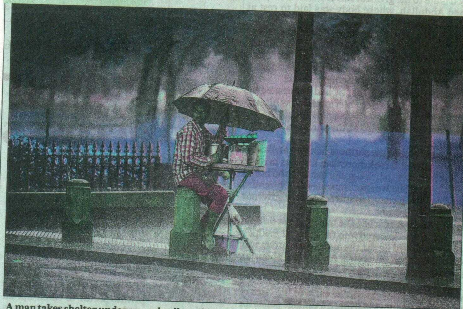
A man takes shelter under an umbrella amid heavy rain in New Delhi on Friday.