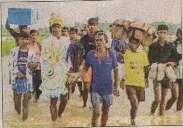
हरदोई के बाढ़ग्रस्त क्षेत्र में रविवार को शादी के लिए दूल्हे और बारातियों को पानी के बीच से होकर जाना पड़ा।

लखनऊ, विशेष संवाददाता। मौसम विभाग ने सोमवार को पूर्वी उत्तर प्रदेश में भारी बारिश होने या गरज-चमक के साथ बौछारें पड़ने का यलो अलर्ट जारी किया है। मंगलवार और बुधवार को राज्य में हल्की से मध्यम बारिश होने या गरज-चमक के साथ बौछारें पड़ने का अनुमान है। गुरुवार 18 जुलाई को पूर्वी उत्तर प्रदेश में भारी बारिश हो सकती है। प्रदेश में फिलहाल बाढ़ का खतरा कम हुआ है। उफनाई नदियों का जलस्तर या तो घट रहा है या फिर स्थिर है। फिलहाल, प्रदेश के छह जिले बाढ़ की चपेट में हैं, जहां नदियां खतरे के निशान से ऊपर बह रही हैं। सीतापुर में गोमती, बलिया में सरयू, आजमगढ़ में घाघरा, हरदोई में गंगा और मऊ में सरयू खतरे के निशान को पार कर चुकी है। गोरखपुर-बस्ती