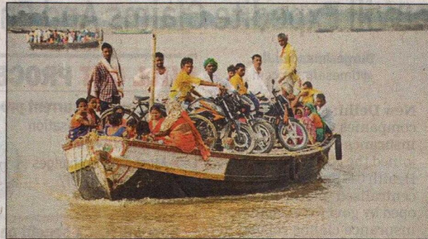
FLOOD OF DEMANDS

While Andhra Pradesh too had similar demands, CM Chandrababu Naidu is now seeking specific projects and a package for the backward regions of the state which too was bifurcated to create Telangana. He gave a long list of projects from an oil refinery to a push for petrochemicals