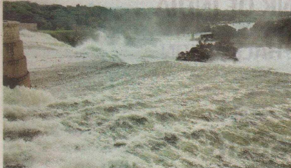
The reservoir level was 123.10 ft as against the full level of 124.80 ft. Officials have advised people to shift to safer place. M.A. SRIRAM