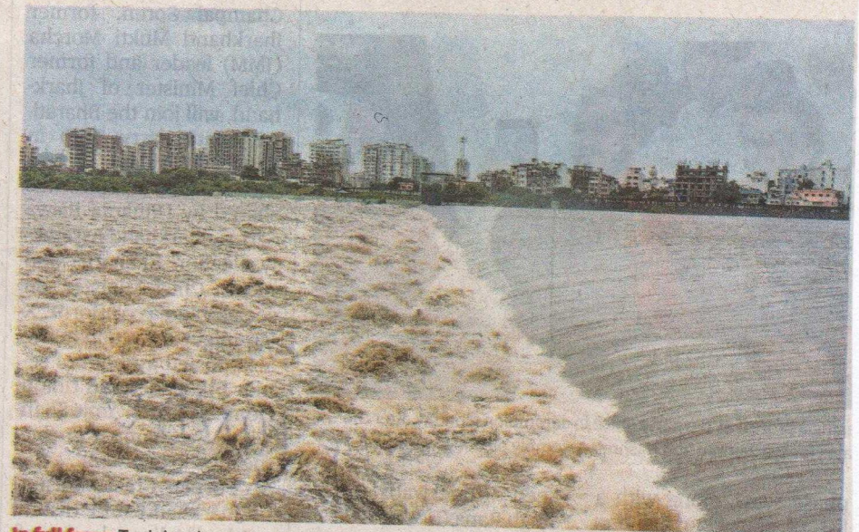
In full force: Tapi river in spate after water was released from the Ukai Dam following heavy rains in Surat, Gujarat on Monday. The State government has advised people to not venture out.

The NDRF teams have been positioned in Gandhinagar, Vadodara, Amreli, Banaskantha, Bhavnagar, Dwarka, Gir Somnath, Junagadh, Kutch, Morbi, Nar-